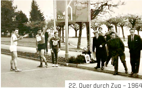
22. Quer durch Zug – 1964

1996 Einmal mehr garstiges und regnerisches Wetter, wie bei den Ausgaben 1990, 1994 und 1995.