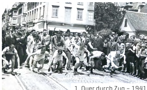
1. Quer durch Zug – 1941

Wir feiern dieses Jahr ein besonderes Jubiläum und schauen auf 80 Jahre Quer durch Zug zurück: Weltkrieg, zunehmender Verkehr und immer wieder das unberechenbare Wetter, welches das Quer durch Zug vor grössere Herausforderungen stellte.