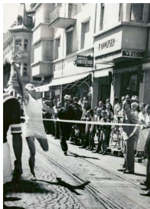
Quer durch Zug – ca. 1948

1995 Ab diesem Jahr werden die Nachwuchs-kategorien ausgebaut.