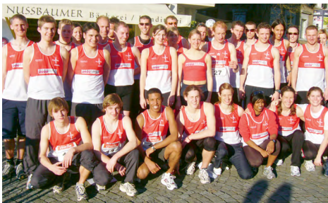
Quer durch Zug mit dem erfolgreichen TV Inwil – 2005

2004 «TV Inwil – das Mass aller [Zuger] Dinge». [Sportjournal] Der Landturnverein dominiert anfangs 2000er Jahre am Quer durch Zug.